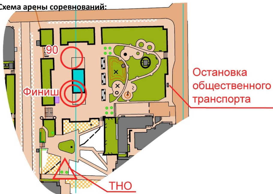
Схема арены соревнований:

Дистанция для групп М21, М18, М35 спланирована в 2 круга.