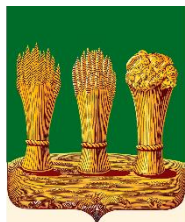
Комитет по физической культуре, спорту и молодежной политике города Пензы

1.1. Общее руководство соревнованиями осуществляет комитет по физической культуре, спорту и молодежной политике г. Пензы. Непосредственное проведение соревнований возлагается на судейскую коллегию, утвержденную Комитетом по физической культуре, спорту и молодежной политике города Пензы