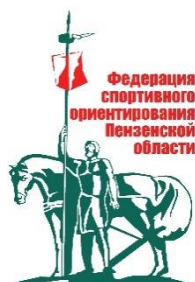
Федерация спортивного ориентирования Пензенской области